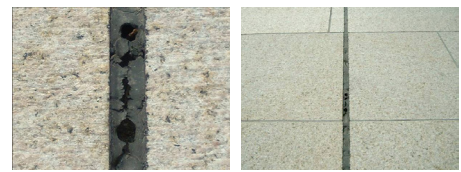
対策にペンギンシール PU979